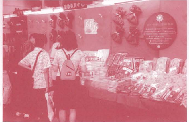
中心攤位的另一角度