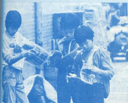
小學生在街上看連環圖畫報