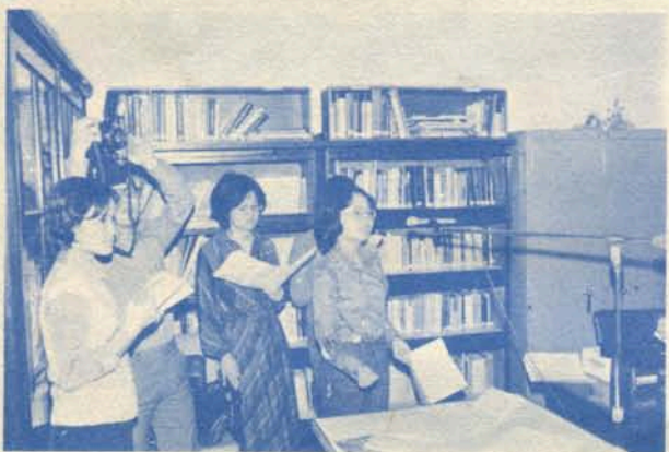
演員進行錄音情況