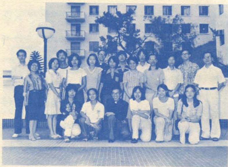
宗教錄音幻燈製作營導師及營友

本中心應各營友要求，將計劃組織教材製作行動組，以繼續訓練編劇、導演、錄音控制、廣播員以及幻燈攝影等人才。俾日後教區能有更多服務這方面的人員，共同推進視聽教材製作事工。