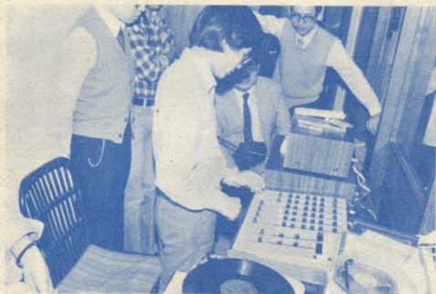
教區宗教教育中心錄音控制室一角