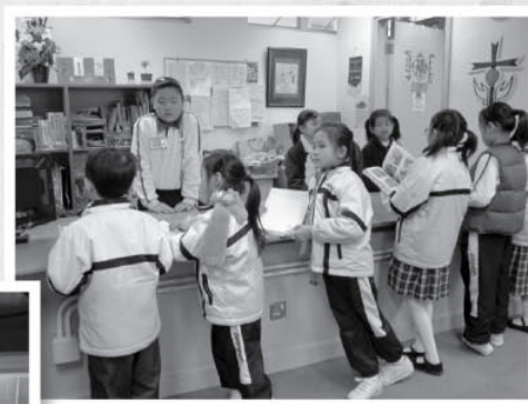
▲ 基福小學學生均懂得善用校內圖書館設施。